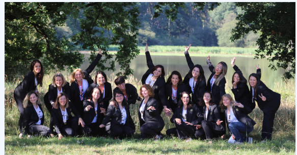
BUREAU NATIONAL ET RÉGIONAL 2025/2026

En 2025-2026, ensemble, nous écrivons demain.